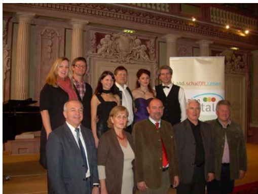
Aufführung der Operette „Wiener Blut“ im Pram- und Donautal im Sommer 2013